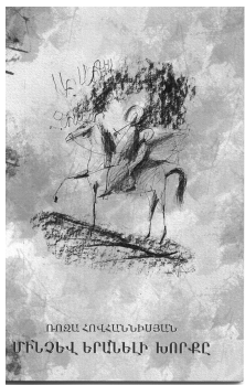
18 նոյեմբերի, 2007թ.

ՀԳՄ Ըհրակի մարզային բաժանմունքում տեղի ունեցավ ԳԱԱ Ըհրակի հայագիտական կենտրոնի գիտաշխատող, բանաստեղծուհի Ռուզա Հովհաննիսյանի երկրորդ՝ «Մինչև երանելի խորքը» բանաստեղծական գոգարիկ ժողովածուի (ձևավորող նկարիչ՝ Վ. Պահլավունի Թաղևոսյան) շքանշանը: Ռեժիսոր Միրանուշ Ղուկասյանի հուզիչ խոսքը խորքային և սահուն անցումներով ընդմիջվեց հեղինակի գրչակից ընկերների սրտաբուխ ելույթներով, ինչպես նաև Երևանի Կոմիտասի անվան պետական կոնսերվատորիայի Գյումրու մասնաճյուղի ուսանողների համերգային կատարումներով: Արտահայտվողներն արժևորեցին բանաստեղծուհու նոր ժողովածուն՝ այն համարելով առաջին ժողովածուի հոգեմտավոր շարունակությունն ու նոր քափ: Օրվա և բանաստեղծության խորհրդին վայել իր օրհնությունն էր բերել Հայ Առաքելական Եկեղեցու Ըհրակի թեմի առաջնորդ Միքայել եպիսկոպոս Աջապահյանը: Բանաստեղծուհին երախտագիտություն հայտնեց Ըհրակի թեմի առաջնորդարանին՝ զրքի մեկենասության համար: