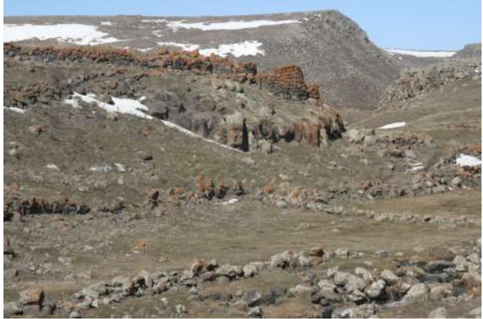
Նկ. 3 Բանդիվանի ամրոցը

Ախուրյանի վերին հոսանքում՝ Ամասիայի դիմաց՝ կիրճ իջնող ափամերձ սարահարթի շարունակությունը կազմող հրվանդանի վրա է գտնվում Բանդիվանի միջնադարյան ամրոցը (նկ. 3) (բարձր.1970մ), որի արևելյան պարսպի հիմքերի մոտ գտնված, նաև հրվանդանի արևմտյան զառիթափ լանջով ցած սահած վաղբրոնզիդարյան խեցեղենի բեկորները փաստում են վաղ բրոնզի դարաշրջանում նրա բնակեցված լինելը: