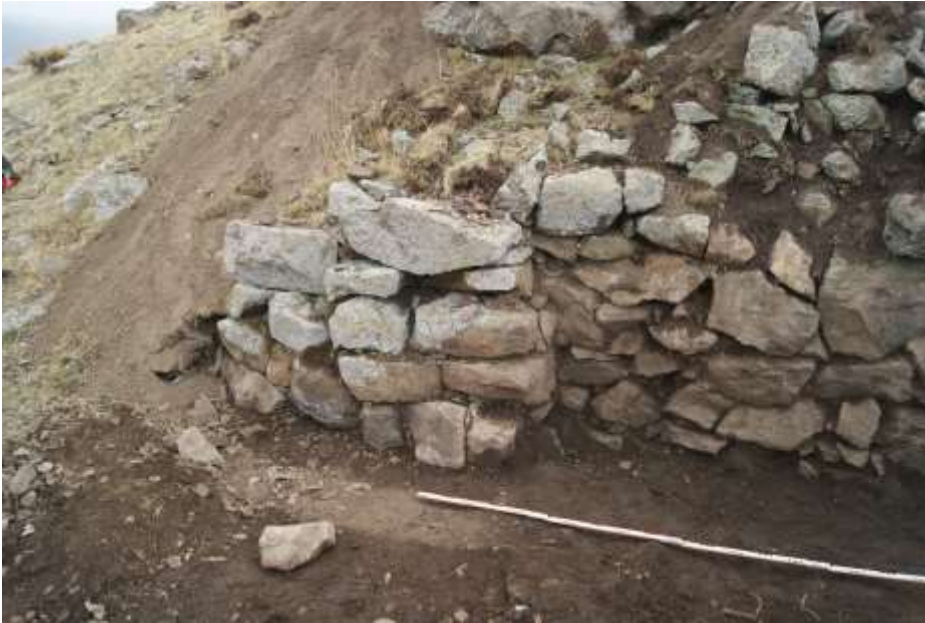
Նկ. 4 Ջրածորի ամրոցը

Գագաթից մոտ 9մ ներքև երկրորդ հարթակն է, որի եզրերն օղակող թափված քարերի տակ տեղ-տեղ շարվածք է երևում: Հյուսիսային կողմում փլվածքների տակից երևացող պարսպի հատվածն ունի կանոնավոր շարվածք, ելնելով ռելիեֆից, երկրաչափական կոր գծագրություն: Ամրոցի կառուցման համար բազալտե ելուստավոր ժայռաբեկորները կտրտվել և հավասարեցվել են՝ ստեղծելով աստիճանաձև հարթակներ: Ժայռաբեկորներից տարբեր մեծության կոպիտ մշակված քարերն օգտագործվել են կառույցների և պարսպի պատերի համար: