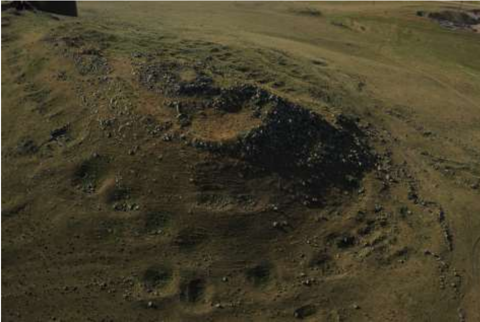
Նկ. 2 Աղվորիկի ամրոցը

րակների նյութերը փաստում են, որ վաղ միջնադարում ամրոցը բնակեցվել է, և կյանքն այստեղ շարունակվել է մինչև ուշ միջնադար: