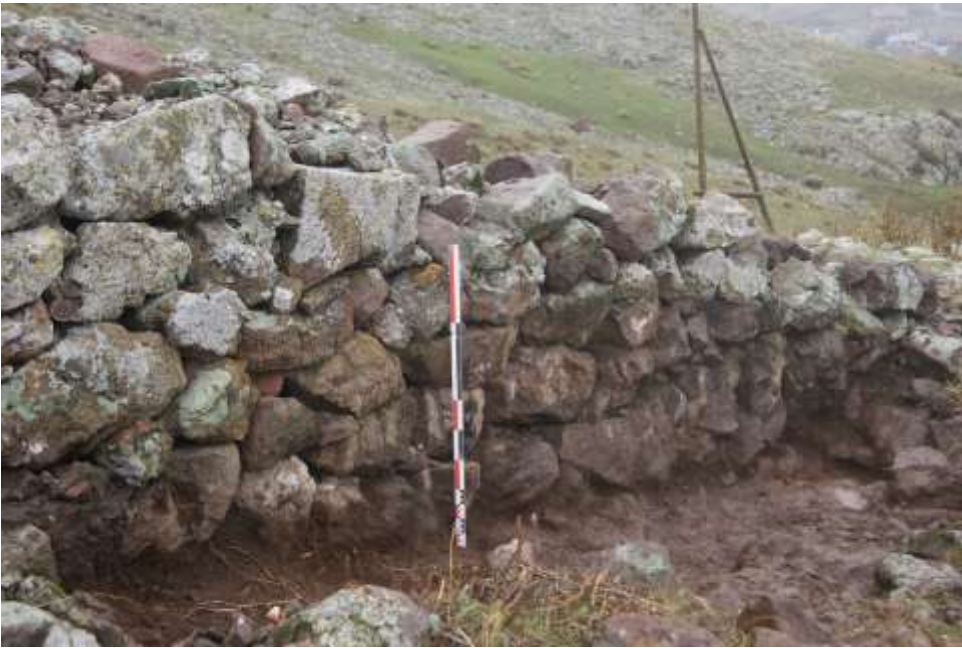
Նկ. 5 Ջրափի

Պարիսպն ունի մեծազանգված անկանոն, անտաշ քարերով, առանց շաղախի, երկկողմ, ծուծը և դաստարկ խոռոչները մանր քարերով լցված կանոնավոր շարվածք: Պատերի լայնությունը 1,70մ է: Ելնելով արևմուտքից վտանգի առավել մեծ հավանականությունից՝ պաշտպանական նկատառումներով ամրոցի արևմտյան կողմն ամրացված է պարսպին կից, երկայնական առանցքով հյուսիս-հարավ ուղղված, 70-սմ բարձրությամբ պահպանված պատերով, իրար հաջորդող, հատակագծում ուղղանկյուն կառույցներով: Պարսպից թափված քարերը գրեթե ամբողջությամբ ծածկել են կից կառույցները: Պարսիպի արտաքին կողմում հավելված կառույցների պատկերն այսպիսին է: Առաջինն ունի 2,60մ լայնություն, հյուսիսային պատի երկարությունը 1, 60մ է, արևմտյան պատը բացակայում է: Հաջորդ երկու փակ ուղղանկյունները համապատասխանաբար ունեն 5,70մ x2,44մ և 5,60մ x 2,90մ չափեր: Այնուհետև պարսպի 3,60մ երկարությամբ հատվածը հյուսիսից և հարավից սահմանափակված է 2,90մ և 2մ երկարությամբ պատերով, իսկ արևմտյան կողմը բաց է: Սրան հաջորդում են ուղղանկյան մեջ առնված, 1,40-1,50մ տրամագծով, իրար կից շրջանաձև չորս կառույցներ: Ամրոցի ճարտարապետական նկարագիրն ամբողջացնել հնարավոր է միայն փլվածքները մաքրելուց և պահպանված կառույցների պատերը բացելուց հետո :