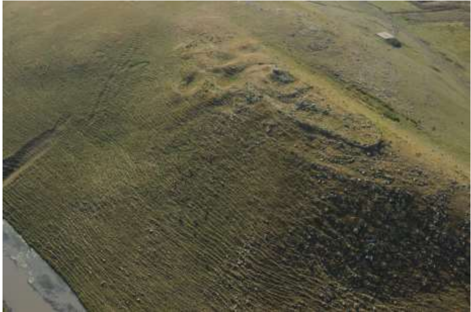
Նկ. 1. Փոքր Սեպասարի ամրոցը

ուշմիջնադարյան խեցեղենի բեկորներ են: Այստեղ ևս որպես շինանյութ ծառայել է տեղի ժայռաբեկորներից ճեղքումով անջատված բազալտը: