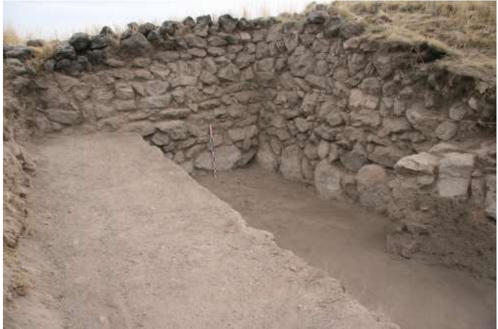
Նկ. 6 Հայկաձոր

Շիրակի մարզի Անիի տարածաշրջանի Հայկաձոր գյուղի վարչական տարածքում, Ախուրյանի ափին, Հռոմոսի վանքի դիմացի հրվանդանի վերին դարվանդի վրա է գտնվում մ. թ. ա I հազարամյակի ամրոց-բնակավայրը (նկ. 6): Ամրոցի արևմտյան պարսպի արտաքին կողմում բացվել է ՅՄ բարձրությամբ պահպանված մի հատվածը աշտարակի անկյան մասում: Պարիսպը կառուցված է տուֆի և բազալտի խոշոր քարերից: Պարսպապատի բարձրանալուն զուգընթաց՝ շարվածքի քարերի չափերը փոքրանում են: Հայտնաբերված նյութերը վերաբերում են մ.թ.ա. I հազարամյակի առաջին կեսին, նաև անտիկ և միջնադարյան են 29 :