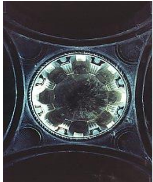
Նկ. 1, 2. Եղեգնամոր եկեղեցին հարավ-արևելքից, եկեղեցու գմբեթի մանրամաս, 06.03.2022