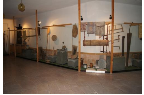
Նկ.3. Հատվածներ Բերդի պատմության և կենցաղի թանգարանի ցուցադրությունից