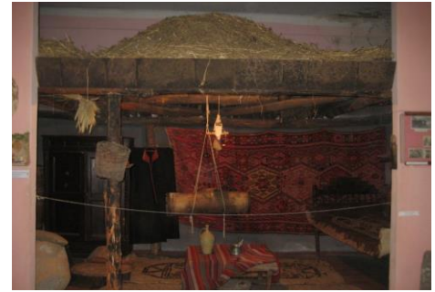
Նկ. 4. Հատվածներ Գեղարքունիքի երկրագիտական թանգարանի ցուցադրությունից