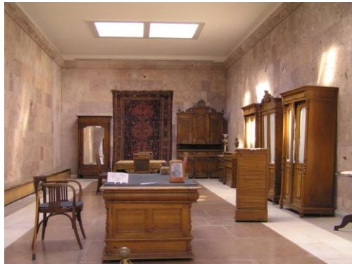
Նկ.1. Հատվածներ Հայոց ազգագրության և ազատագրական պայքարի պատմության թանգարանի ցուցադրությունից