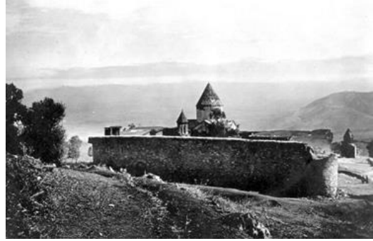
Անահիտ դիցուհու տաճարը / Առաքելոց վանքը

VII դարի պատմական քաղաքական բարդ իրադրությունների պայմաններում Ներսես կաթողիկոսի ծավալած գործունեության շնորհիվ Հայաստանը ապահովագրվեց արաբների հետագա արշավանքներից: Եվ կաթողիկոսը նախաձեռնեց այնպիսի շինարարություն, որը, ինչպես Թորամանյանն է գրում, «որչափ կրոնական, այնչափ էլ քաղաքակրթական նշանակություն ուներ» 10 : Զվարթնոցը նվիրված է երկնային արթուն ուժերին՝ «յանուն երկնային գուարթնոց», ենթադրվում է, որ այն կառուցվել է հեթանոսական Տիր աստծո մեհյանի վայրում, իսկ նրա հատակագիծը ունի «բանալու» ուրվագիծ՝ կողավորելով հեթանոսական գաղափարներ ու հասկացողություններ 11 :