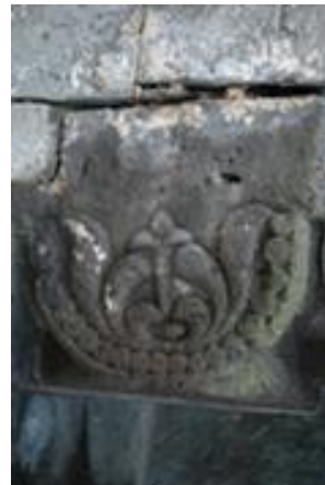
Որոտնավանք / Սյունիք

Տրամաբանական հարց է ծագում. ովքե՞ր էին հին գիտելիքների կրողները, ո՞ւմ հաջողվեց քրիստոնեություն ներմուծել հեթանոսության գաղափարները: Նախ՝ դրանք