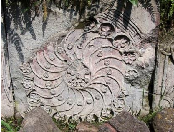
Տեղեկաց մենաստան. 12-րդ դար