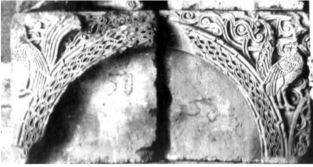
Նկ. 2 Թռչուններ, կամարաշարի դրվագ, Բախտաղեկի եկեղեցի