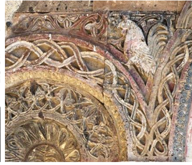
Նկ. 3 Աքաղաղ, Տ. Հոնենցի եկեղեցու արևմտյան. ճակատի կամարաշարի դրվագ.