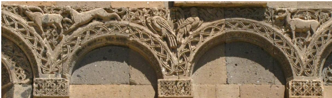
Նկ. 1 Կենդանավազք (քարայծ, հովազ), զույգ հուշկապարիկներ, քարայծ Տ. Տոնենցի եկեղեցու հարավային ճակատի ծոփորի դրվագ