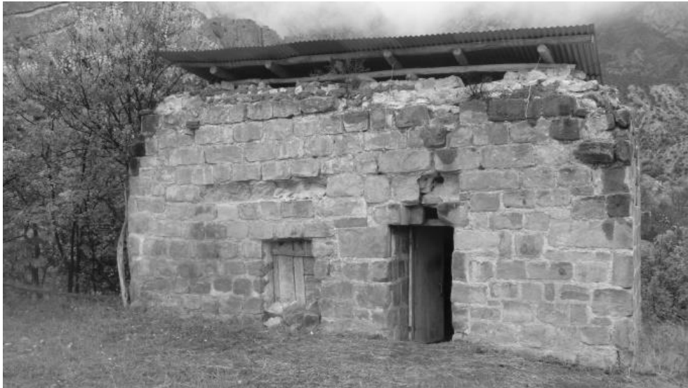
Նկ. 3, 4: Աշտարակ մուտքը, պարսպապատը և աղյուսաշեն եկեղեցին, Հարավային եկեղեցին: