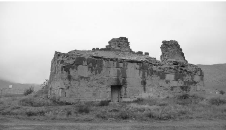
Նկ. 1, 2: Սմրոցը՝ վէրևոմ, բնհկհվհյորը և վհնսկհն հհմհվիրի օժհնդհկ կհռոլցները: Գլիսհվոր էկէղէցու հվէրհկնէրը: