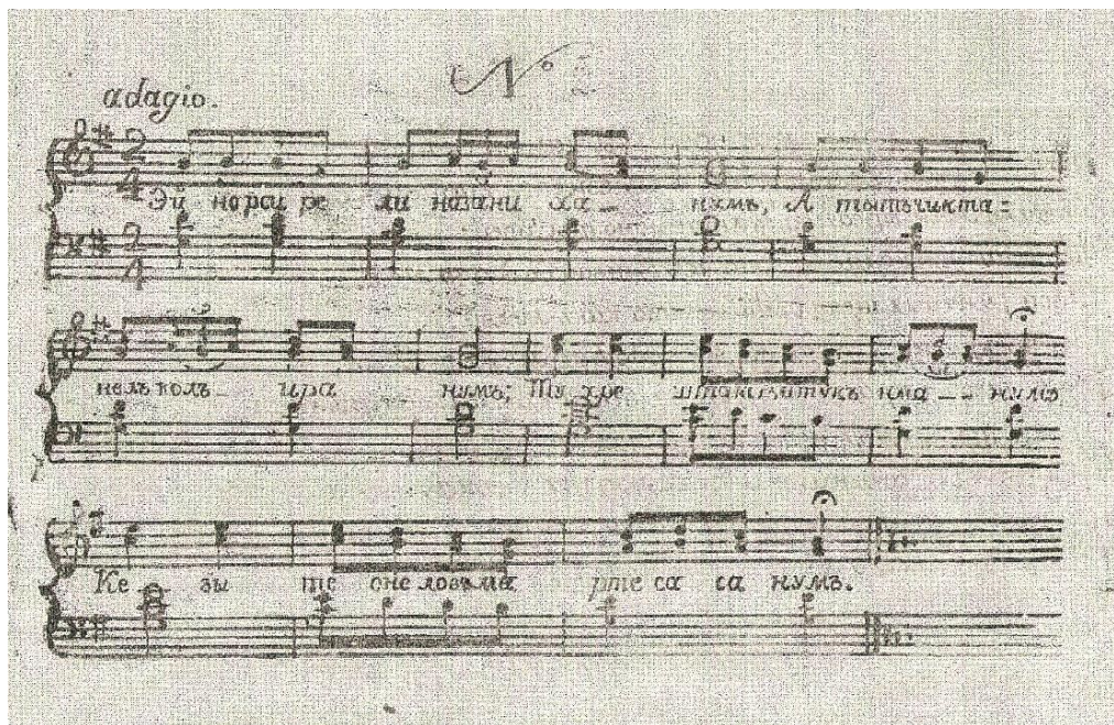
Դարձյալ ակնհայտ են աշուղական երգերին բնորոշ խնամված դարձվածքներն ու հանգածները: Հետաքրքիրն այն է, որ մոնոդիկ երգը ծավալվում է h հիմքով փոուզիական միտրում, մինչդեռ բազմաձայն մշակումը կատարված է G-dur տոնայնության մեջ: